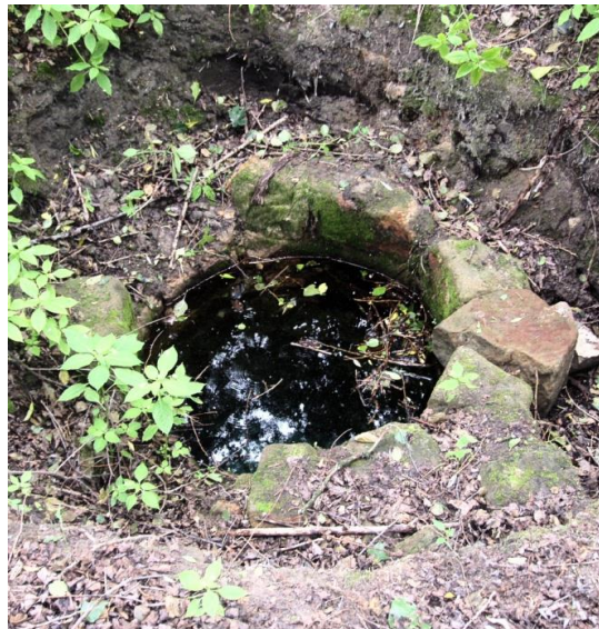
Odkrytá studánka u Červené kapličky (foto z 30. 6. 2006).

Mimochodem: oprava včetně posunutí nebyla financována z privátních zdrojů ani nebyla vyhlášena veřejná sbírka, gró se téměř nedotklo ani rozpočtu obce.