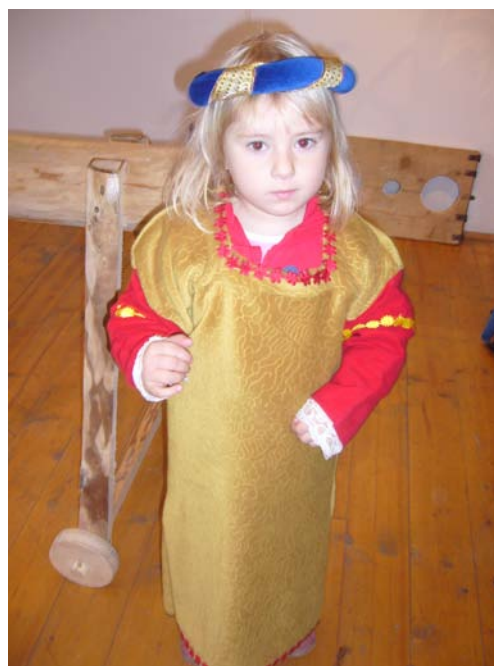
Na výstavě „Život na tvrzi renesančního rytíře“